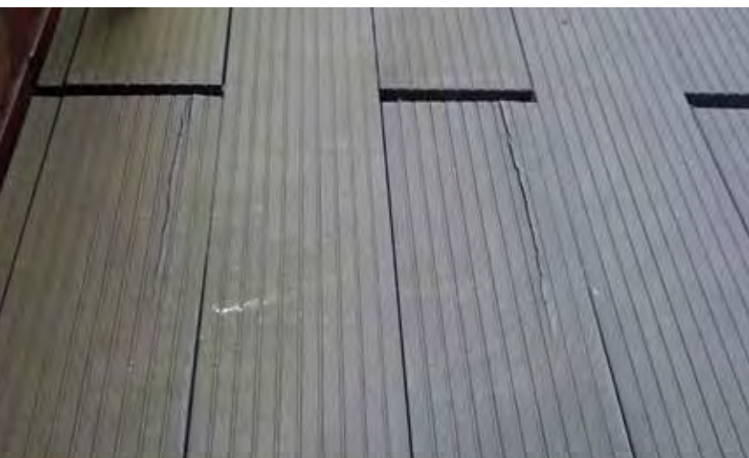
Rissbildung in den WPC-Dielen.

Bei der Verarbeitung der Dielen ist generell zu beachten, dass zum besseren Wasserablauf ein Gefälle in der gesamten Konstruktion einzuplanen ist. Bezüglich der Montage der Dielen ist darauf zu achten, dass sich das Material durch klimatische Einflüsse ausdehnen bzw. schrumpfen kann. Dementsprechend muss in diesem Fall ein Abstand zu festen Gebäudeteilen von mindestens 3 cm eingehalten werden. Zwischen den Dielen muss der durch den Klipp vorhandene seitliche Abstand von ca. 2 mm eingehalten werden. Der Abstand bei den Kopfstößen der Dielen sollte zwischen den Kopfstößen mindestens 1 cm betragen. Nach der Überprüfung der Verarbeitungsvorschriften konnte der technische Berater keine Abweichungen feststellen. Das verar-