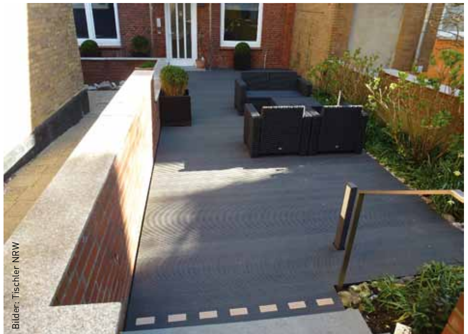
Die Terrasse nach dem Verlegen der WPC Dielen.

Das Material WPC besteht zu ca. 50 bis 70 Prozent aus Holzmehlen/Holzfasern und zu ca. 30 Prozent aus thermoplastischen Kunststoffen. Zusätzlich werden noch weitere Additive (Stabilisatoren), beispielsweise für