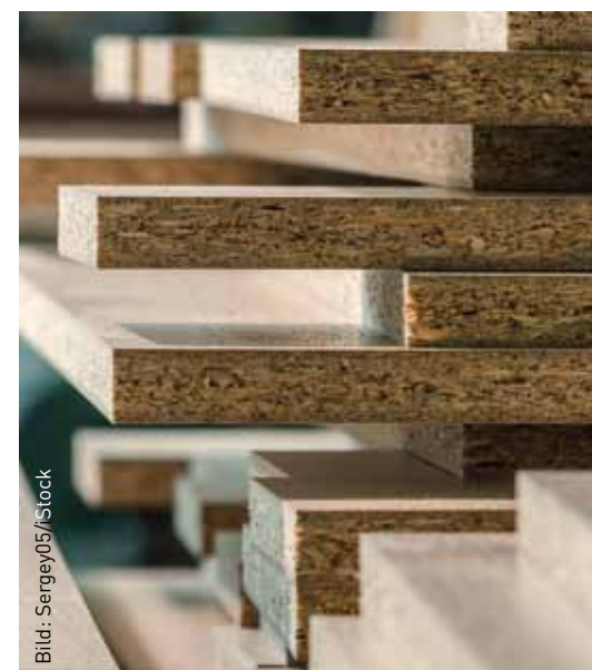
Ab 1. Januar 2020 dürfen nur noch Holzwerkstoffe verarbeitet werden, die nach dem neuen Prüfverfahren zur Bestimmung des Formaldehydgehaltes den Grenzwert von 0,05 ppm einhalten.

Dagegen hat die Europäische Holzwerkstoffindustrie vor dem Europäischen Gerichtshof Klage eingereicht. Die Bund-/Länder Arbeitsgemeinschaft Chemikaliensicherheit (BLAC) hat in ihrer letzten Sitzung Mitte September 2019 entschieden, dass an dem Umstellungszeitpunkt 1. Januar 2020 für die neue Referenz-Messmethodik gemäß DIN EN 16516 und die damit einhergehende faktische Absenkung des Material-Grenzwertes für Formaldehyd von derzeit 0,1 auf 0,05 ppm festgehalten wird. Somit müssen ab dem kommenden Jahr die verschärften Anforderungen für Holzwerkstoffe erfüllt werden. ■