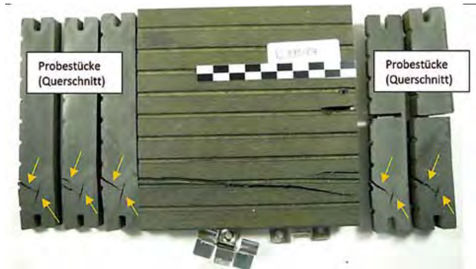
Bild 3: Untersuchung der WPC-Probe: Beidseitig wurden Probestücken abgetrennt. Die Anordnung und die Ausbildung der Risse innerhalb der Probe sind gleich.

Im nächsten Schritt wurde eine verbaute Paneele zur makro- und mikroskopischen Strukturuntersuchung an ein Prüfinstitut gesendet. Die Außenflächen der WPC-Dielenproben wurden im Normallicht bei 5- bis 100-facher Vergrößerung untersucht. Anschließend wurde die Probe in mehreren Bereichen quer aufgetrennt. Die Querschnittflächen wurden mit einer Spezialschleifeinrichtung feinstgeschliffen und ebenfalls mikroskopisch auf Unregelmäßig-